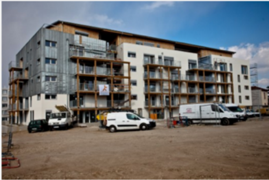
Les logements devraient être livrés en juin.

Avant de partir, on lui demande ce qu'il ressent en voyant enfin cet ambitieux projet sur le point d'aboutir : "Ces huit années n'étaient qu'une gestation ! Comme pour la naissance d'un enfant, c'est maintenant que tout démarre vraiment."