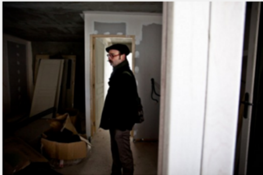
Dans un des appartements du "Village vertical", encore en travaux.