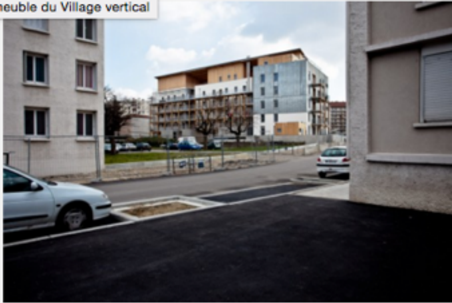
L'immeuble, éco-conçu, se dresse au cœur d'un quartier populaire de Villeurbanne.

Le village vertical va devenir un projet pilote, et ce à plus d'un titre. Les futurs habitants nouent un partenariat avec les collectivités locales et la coopérative HLM Rhône Saône habitat (RSH) : les premières – le Grand Lyon et la ville de Villeurbanne – vont leur céder un terrain à bâtir en dessous des prix du marché ; RSH va, elle, porter la maîtrise d'ouvrage de la construction. Le projet aura bien une dimension solidaire en intégrant des logements destinés à des personnes en insertion. Le groupe d'habitant doit par contre penser plus grand. "Construire seulement dix logements serait revenu beaucoup trop cher, indique Benoît Tracol, directeur général de RSH. L'immeuble en compte finalement trente-huit : quatorze constituent le "village vertical", dont quatre sont destinés à l'accueil de jeunes en insertion ; nous gérons les vingt-quatre autres. Eux vont se loger à un prix raisonnable, et cela nous permet à nous de créer de l'accession sociale à la propriété. Le tout, en renouant avec une dimension qu'on avait un peu oubliée de notre travail de coopérative sociale : coopérer, "travailler avec".