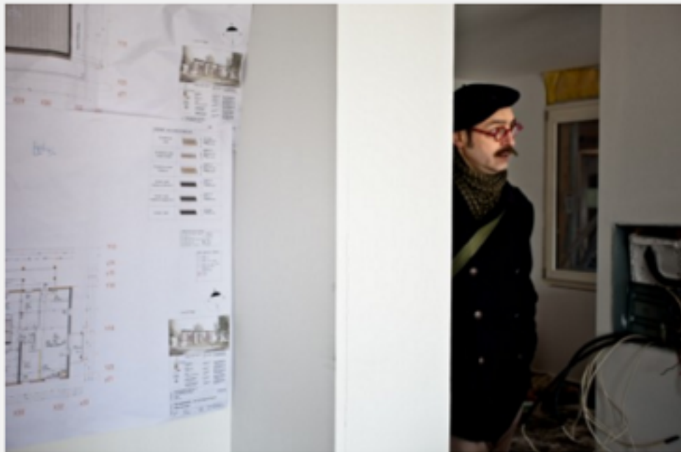
Dans ce projet, l'implication des futurs habitants est allée très loin, jusque dans les négociations avec les artisans pour les pousser à utiliser des matériaux plus écologiques.